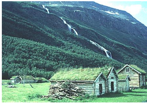
Holmenes sjøsamiske gård i Birtavarre, Gáivouna suohkan/Kåfjord kommune.

Nord-Troms Museum har et hovedanlegg i hver av de seks Nord-Tromskommunene: Slettnes gjenreisningsgård i Kvænangen, Tørfoss kvengård i Nordreisa, Maursund handelssted i Skjervøy, Holmenes sjøsamiske gård i Gáivuotna/Kåfjord, Skibotn markeds plass i Storfjord og Alf Gamsletts fiskerbondegård i Lyngen (se http://ntrm.no/ ). Anleggene er i god forfatning og med autentisk interiør. Museumsområdene består også av store utearealer.