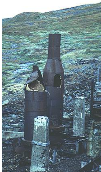
Linbane og smelteovn i Moskodalen gruver.

Stedsnavn er en annen type kulturminner som kan omfattes av Ut og forsk! Regionen er rik på både samiske og kvenske stedsnavn. Noen av disse er i ferd med å gå i glemmeboka. Ikke minst er det mange navn som de fleste ikke forstår betydningen av. Også kystlandskapet blir ofte oversett. Mange kjenner nok til betydningen av begrep som dyp, grunne, bakke, egg, banke og skjær. Andre begreper er nok for mindre sjøvante mer ukjente, slik som flu, rås, fall, tarra, fles, drunk, skag og snag. Alt dette er benevnelser på formasjoner under vann med forskjellig navn etter for eksempel hvordan havet bryter over, om det ligger langt under