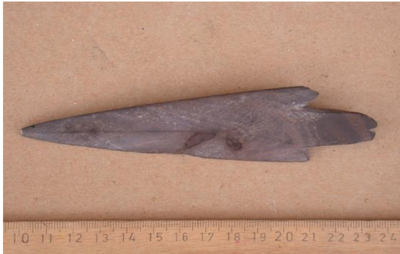
En spydspiss i skifer funnet på Melkøya.

På steinalderlokaliteter er det funnet kokegroper. Et hull i bakken ble foret med stein. I den steinforede gropa ble det brent et bål. Når dette hadde brent tilstrekkelig, ble varmen magasinert i steinene. Maten ble da lagt i gropa, og åpningen dekket til. På den måten kunne man steike både kjøtt og fisk. Slike groper er enkle å lage. I kassen kan det derfor legges ved en beskrivelse av hvordan en slik lages sammen med litt ”steinaldermat” som elevene får tilberede ute.