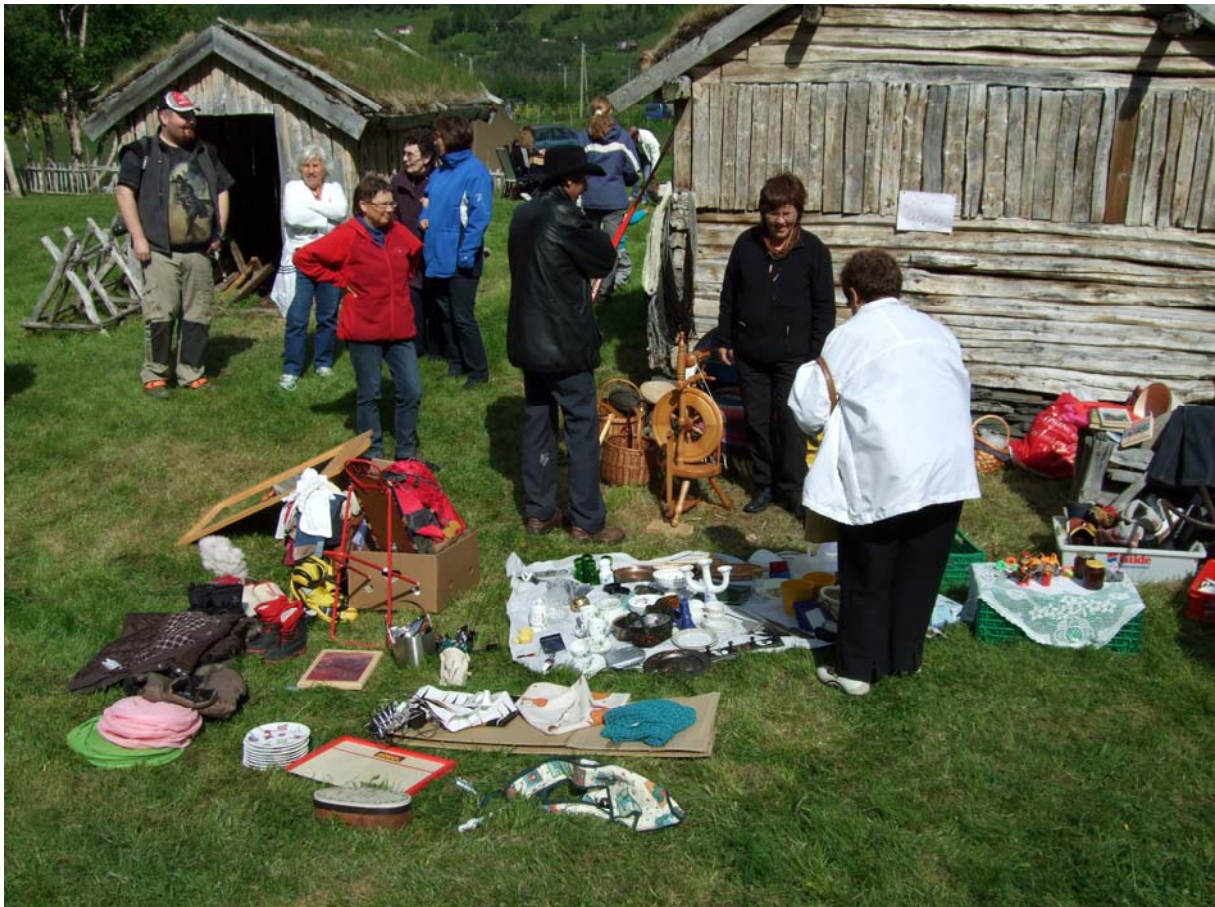
Bildet er tatt på markedsdagen på Holmenes 5.juli 2008. Årets marked var den tiende i rekken. Det var ca. 450 besøkende. Her er salget av lopper i full gang. Rundt på tunet var det salgsboder og utstillinger av diverse produkter. Besøkende kunne også få innblikk i gamle kulturtradisjoner som plantefarging, toving etc. Museet retter en stor takk til alle som støtter opp om markedsdagen!

Nord-Troms Museum er et regionsmuseum som virker over et stort område. I sommersesongen kan vi tilby aktiviteter og arrangementer over hele nord-troms. Om tilbudet i en kommune kan virke lite, er aktiviteten samlet sett meget stort. Tilbudene er varierte, spennende og ofte utført med solid kompetanse på regionens kulturhistorie. I sommersesongen er aktiviteten i museet på topp blant faste ansatte, sommerguider og frivillige fra lag og foreninger omkring i nord-troms.