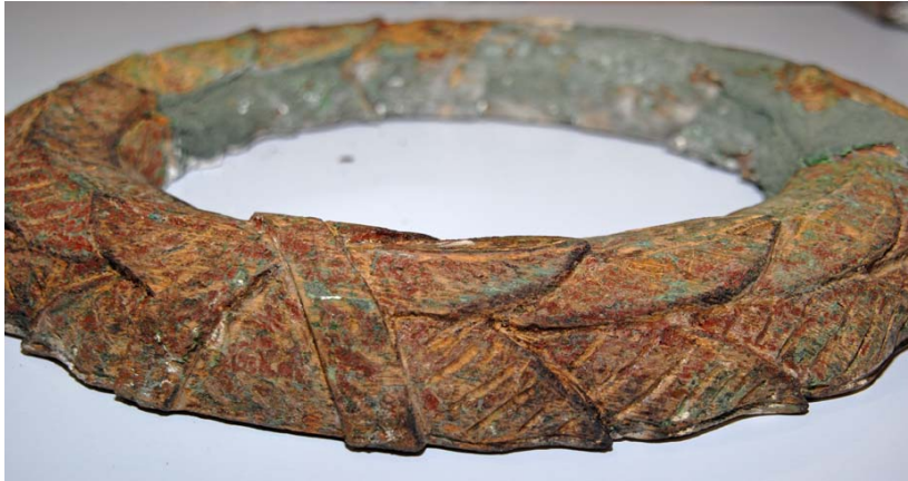
Restaurering av kransen til Maursund gård.